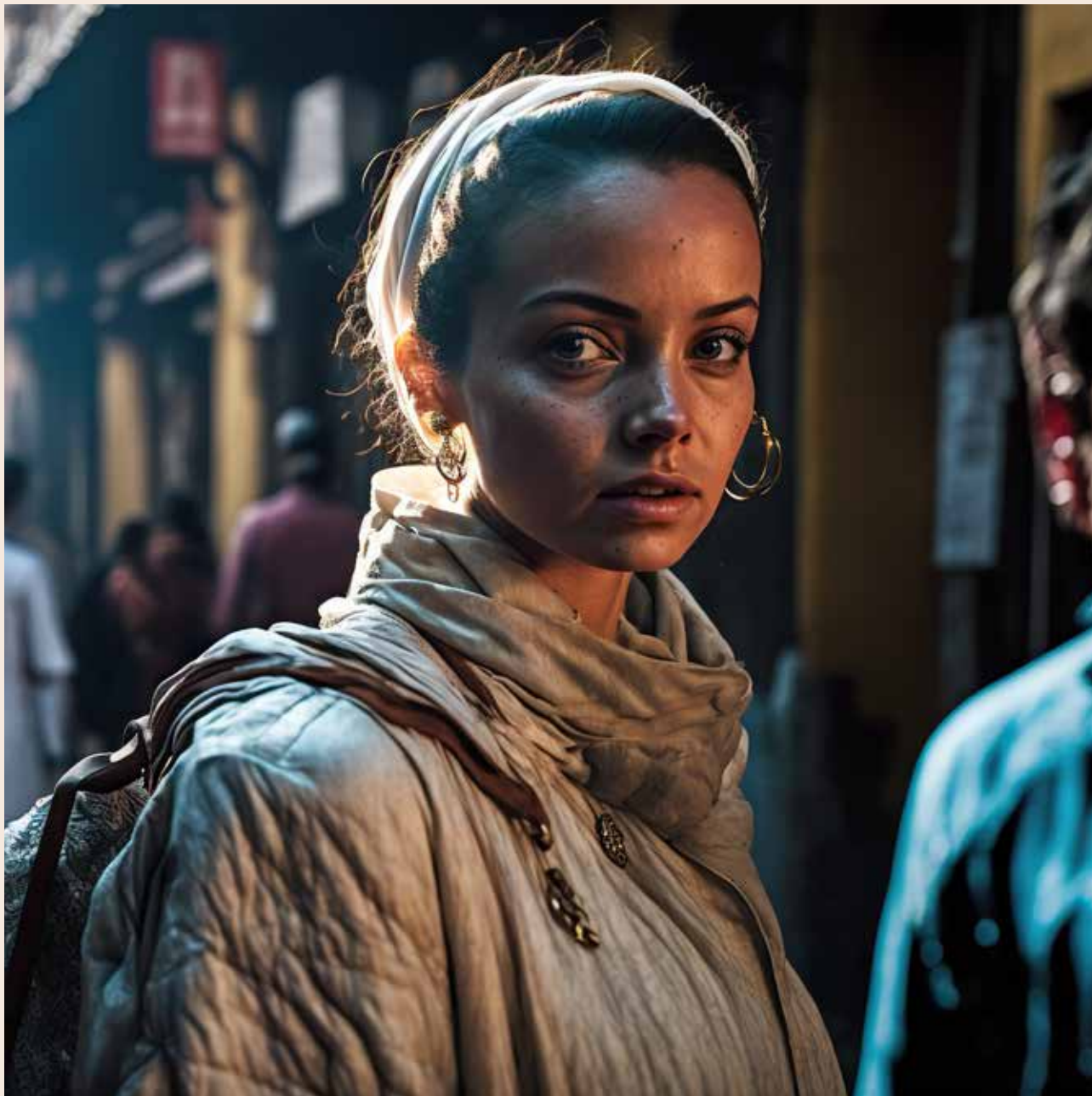
Nivarha - la guerra dimenticata