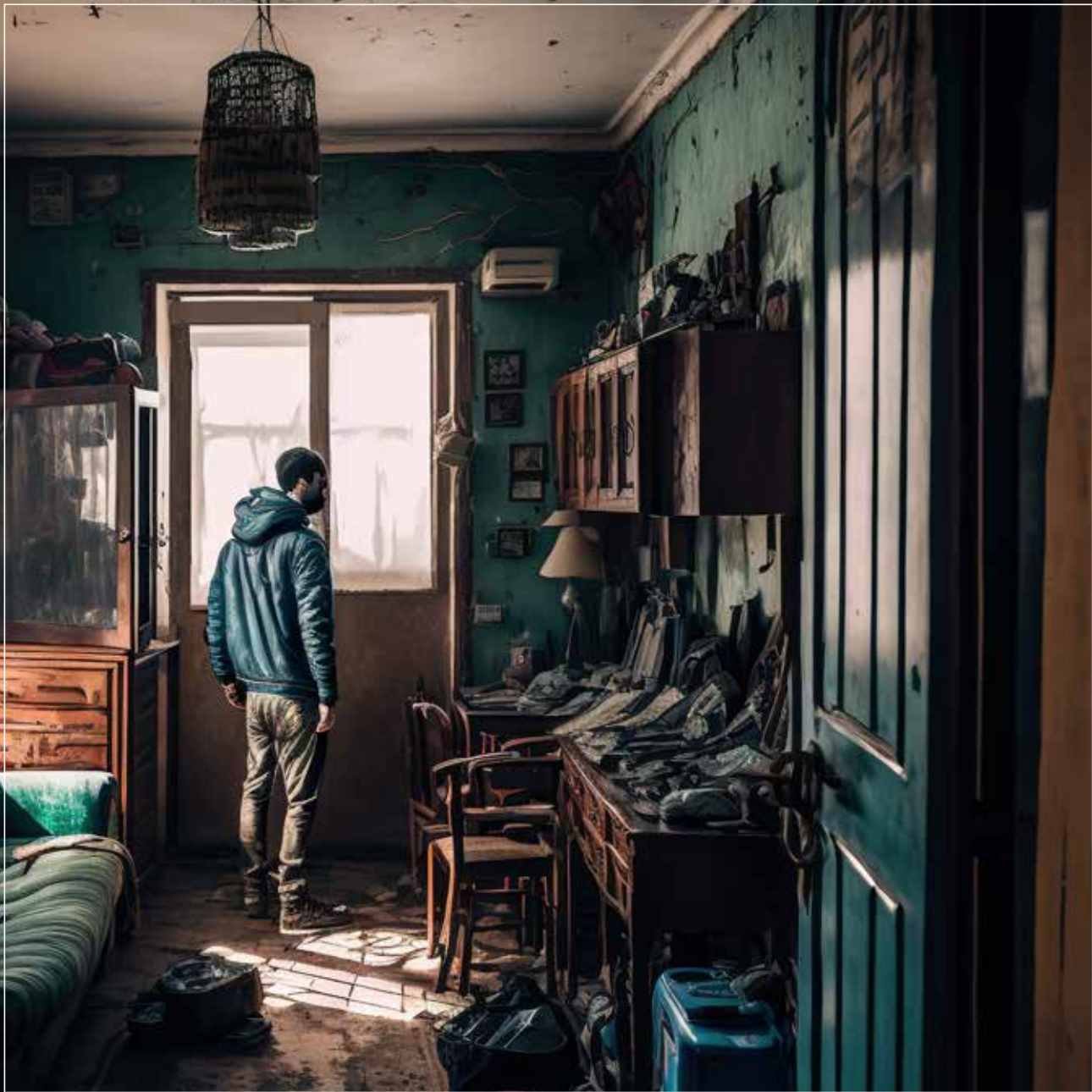
© Mirco Tangherlini - Nivarha - la guerra dimenticata